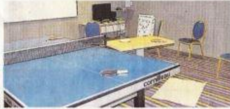
La salle d'activités : console et table de ping-pong ont été louées par l'hôtel.