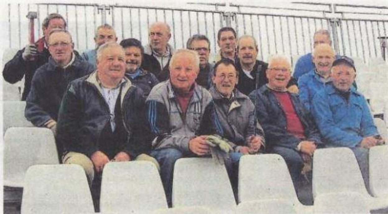
Les bénévoles testent les 502 sièges qu'ils viennent de mettre en place dans la tribune joueurs.

Les spectateurs découvriront aussi, à l'entrée, un nouveau village, tout en chapiteaux blanc et vert et un nou-