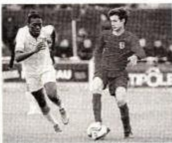
Les Nantais, ici contre la Vendée (3-0), se sont qualifiés pour les demi-finales.

La démonstration équilibrée, vendredi après-midi, face à l'OM à La Guyonnière (0-0), celle de supériorité, samedi matin, devant Evian, à La Bruffière (3-1) ou l'après-midi, face à la sélection de Vendée, à Montaigu, confirment les propos du technicien ligérien qui reconnaît : « Comme pour toute compétition, l'essentiel est de bien commencer. C'est ce que les joueurs ont fait. Même si, face à Marseille, le match s'est soldé par un nul, c'était une rencontre plaisante, avec du rythme. » Le cru nantais 2015 affichera-t-il, au palmarès du tournoi, le nom-