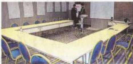
Le salon de l'Yeu fait office de salle de classe.