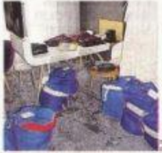
Équipements stockés, chambre 314.