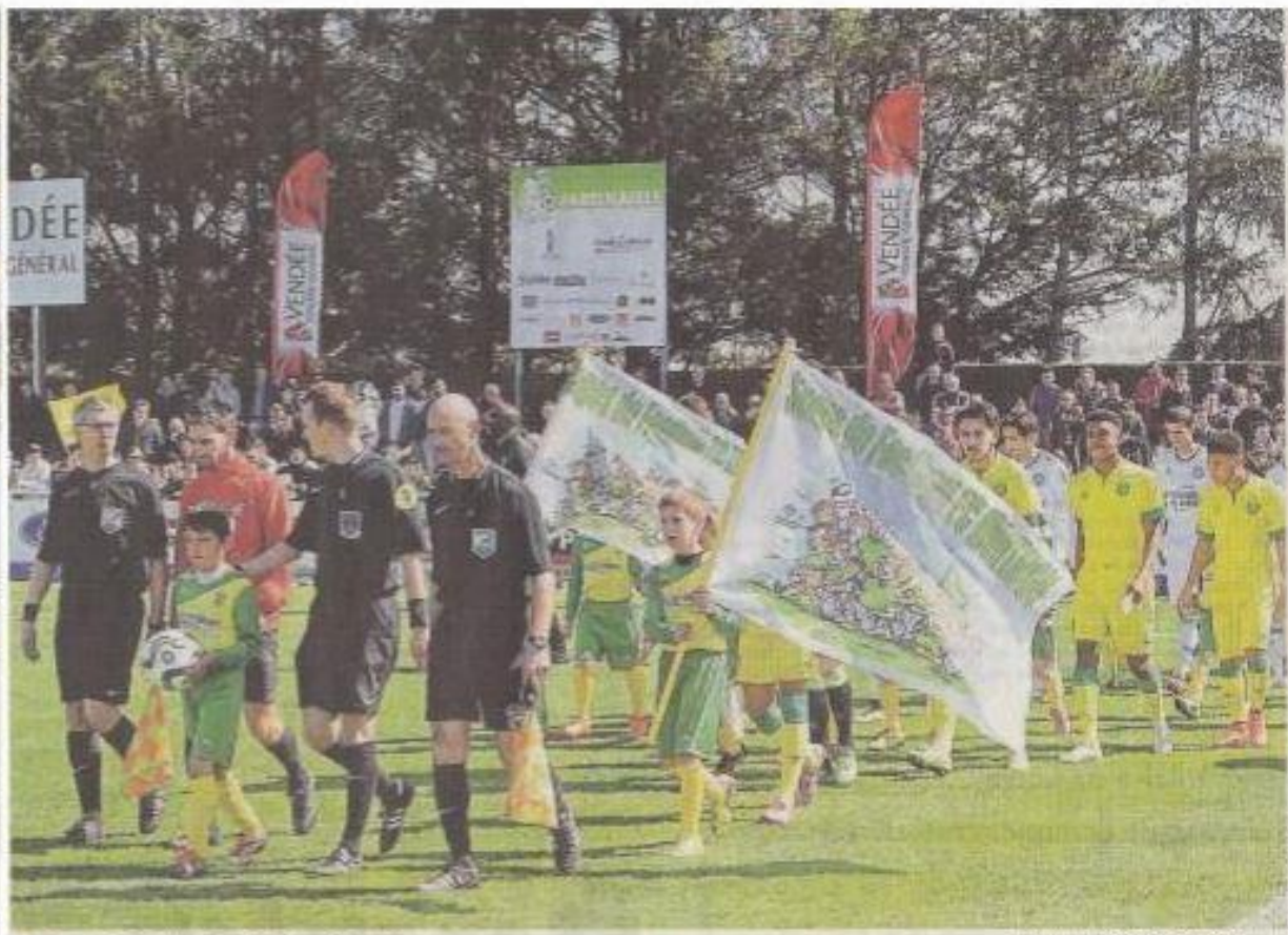
L'entrée des joueurs de la finale club sur la pelouse.