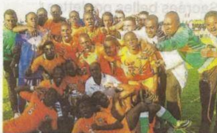
À sa 7 e participation (2014), la Côte d'Ivoire a dominé la Corée du Sud en finale.

tion souhaite que la sélection 2015 lui rappelle davantage celle venue transformer l'essai de 1984. « Le Brésil s'était imposé 1-0, en finale, aux dépens de la France de Didier Deschamps (déjà). En pratiquant le football qu'on connaît... ou plutôt celui qu'on connaissait ! Il semblerait que les Brésiliens aient entamé un gros travail de reconstruction au