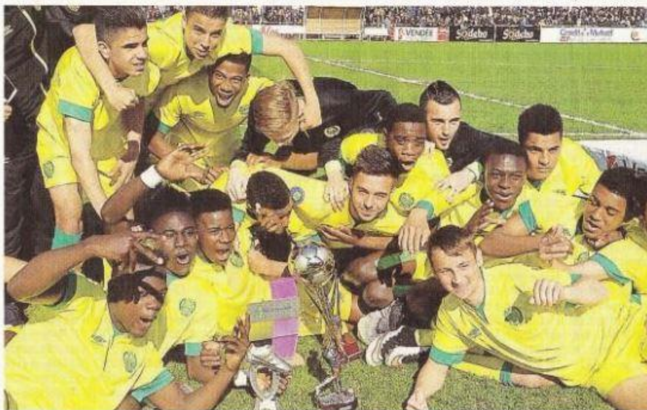
Hier, face à l'Olympique de Marseille (2-1), les jeunes Nantais ont conquis leur 9 e titre à Montaigu. Que du bonheur...

Samedi 4 avril. Lyon - Reims (1-0), Rennes - Lens (0-0), Marseille - Vendée (1-0), Nantes - Evian TG (3-1), Lens - Reims (1-0), Lyon - Rennes (1-0), Nantes - Sélection de Vendée (3-0), Marseille - Evian TG (2-1).