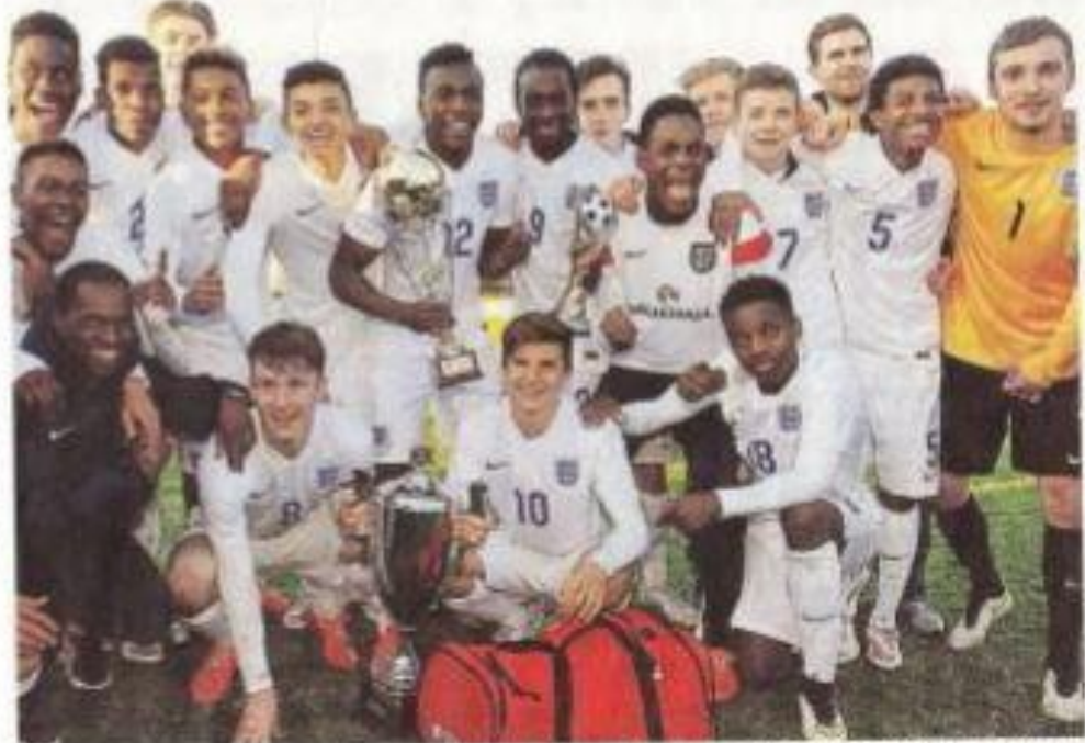
L'Angleterre en titre. Sur leurs sept dernières finales à Montaigu, depuis 2007, les Anglais ont remporté à quatre reprises.

Lire également nos reportages sur le FC Nantes et Michel Etions, entraîneur des gardiens de l'équipe de France sur ouest-france.fr