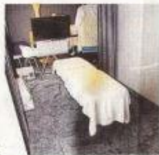
La chambre 315, une salle de soins.