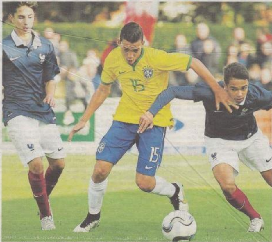
Vainqueur du Brésil (photo), la France affrontera l'Angleterre, lundi (17 h 30), en finale à Montaigu. page 24