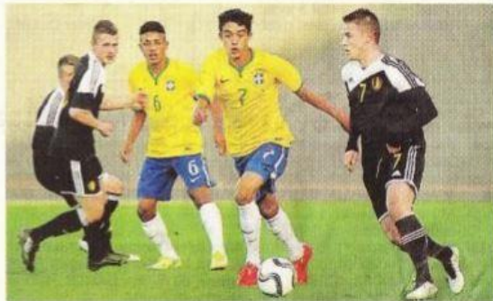
Après avoir fait match nul dans leur confrontation, le Brésil et la Belgique poursuivent leur tournoi ce jeudi. Respectivement contre le Maroc et la France.