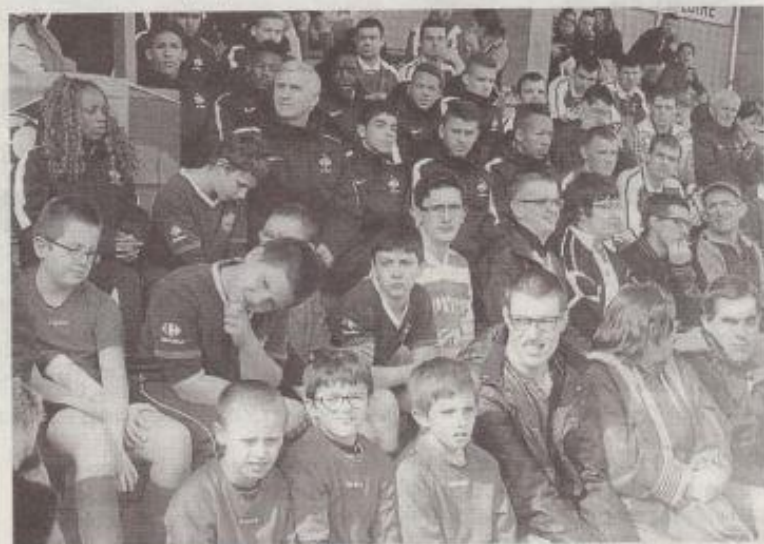
L'équipe de France des U16 a côtoyé les 140 joueurs du football adapté, dans la tribune de Montaigu.

Mercredi, jour de relâche du challenge des Nations, le District de football de Vendée avait programmé un rassemblement des équipes de football adapté, avec quatorze structures présentes et 140 joueurs sur les terrains et dans les salles de sport.