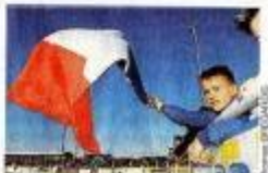
Un jeune supporter de la France.