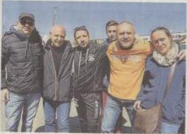
Un groupe de fidèles supporters a fait le déplacement spécialement de Périgord, en Dordogne.