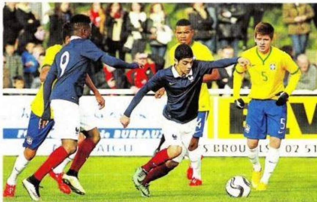
Une première depuis 2011... les U16 tricolores sont en finale, à Montaigu. Ils visent un 10 e titre qu'ils convoitent, depuis 2006.