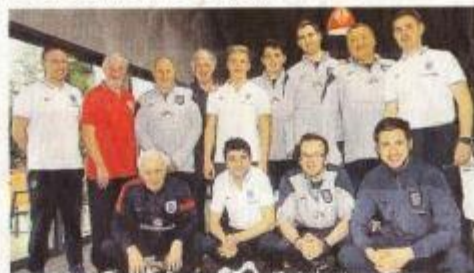
Steve Cooper, le head-coach de l'Angleterre (1 er à gauche) et son adjoint (2 e debout à droite) travaillant avec 11 autres personnes. Une autre équipe de football en somme. L'équipe de l'ombre...