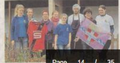
Une partie de l'équipe de la sélection de Montépiél, lors d'un séminaire de préparation au Mondial de Montaigu.

(Lire aussi en page 13 et dans le cahier Sports)