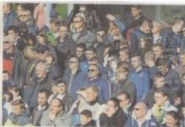
Le public face au soleil lors de la finale France - Angleterre.

Les spectateurs ont répondu présent pour cette 43 e édition du Mondial de football montacutain. Soleil et matches de haute volée ont ponctué ces trois jours. Retour en images le jour de la finale.