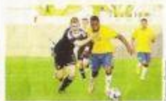
Hier soir, au stade Henri-Desgrange de La Roche-sur-Yon, le Brésil a été tenu en échec par la Belgique (1-1).