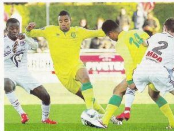
Malgré un essai offensif, les jaunes canariens ont dû attendre, hier soir, la séance des tirs au but, pour valider leur place en finale.