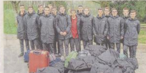
La sélection de Montépiél pour ses séjours au village des Pinserons pour quatre jours.

« Il faut dire qu'il est tout pour s'adapter aux besoins des joueurs et des entraîneurs. » Les repas comportent des légumes, tout au petit déjeuner ; il n'y a pas de saucis sur les tables, ni de desserts sucrés, sauf en fin de journée.