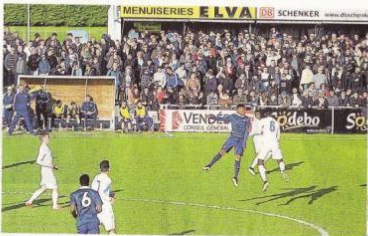
Hier, après-midi, à Montaigu, un stade bondé pour la finale des Nations qui opposait la France à l'Angleterre.