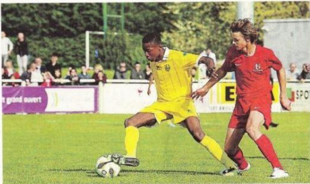
Les jeunes joueurs des clubs et des nations s'affrontent sur les terrains de Montaigu et ses environs, tout le week-end pascal.

Ce dimanche, tous les matches se jouent à Montaigu, à partir de 10 h 30. Les demi-finales auront lieu à 16 h et 18 h. Lundi, la finale des clubs est programmée à 15 h 15, à Montaigu, avec une remise des trophées à 16 h 45.