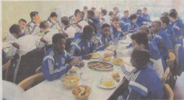
Marseille et Lyon assurent le menu du jour : bouillie de sarrasin, poquefrites de veau, pommes de terre rôties, bœuf et arrosés de ranches.

Ces personnes-là sont forcément un peu spéciales. Ils sont venus de tout l'hexagone, depuis le réseau de séminaires pour participer au 43 e Mondial football de Montaigu, avec des matches sur les terrains de Montaigu, La Bruffière, La Guéronnière et Boufféré. Et ils sont hébergés au village des Pinserons, qui met les petits plats dans les grands en matière de logistique. 174 lits, sur les 200 que compte le site, sont occupés par les joueurs âgés de moins de 18 ans et une trentaine de membres des staffs techniques des clubs du Mondial.