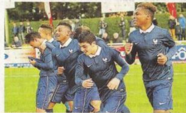
Le but des Français hier contre la Belgique permet aux Bleuets de se qualifier pour la finale. Son adversaire sera la Côte d'Ivoire ou l'Angleterre, qui s'affronteront samedi.

Après sa défaite face à la France en ouverture, le Maroc, invité de dernière minute en remplacement de