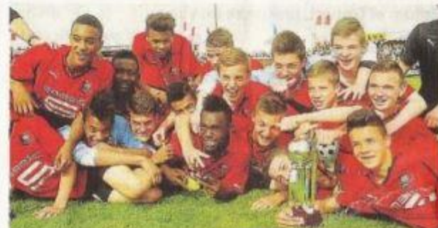
La succession au Stade Rennais, vainqueur du Challenge des clubs en 2014, est ouverte. Début du tournoi ce vendredi.