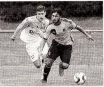
Evian TG : une victoire en trois matches. Pas si mal pour des débuts en Vendée.

Pour sa première participation au Mondial de Montaigu, Évian-Thonon-Gaillard est heureux d'annoncer que 16 joueurs sur les 18 retenus, dont deux U15, « et 80 % des effectifs globaux », sont issus des deux départements, Savoie et Haute-Savoie. « On souhaite s'identifier à la région et s'enraciner. C'est une volonté de club », explique le coach vosgien, qui fixe le cap à ses ouailles : « Qu'ils ne soient pas inhibés, qu'ils jouent comme ils savent le faire. Cette compétition tranche avec l'ordinaire, permet de s'étalonner