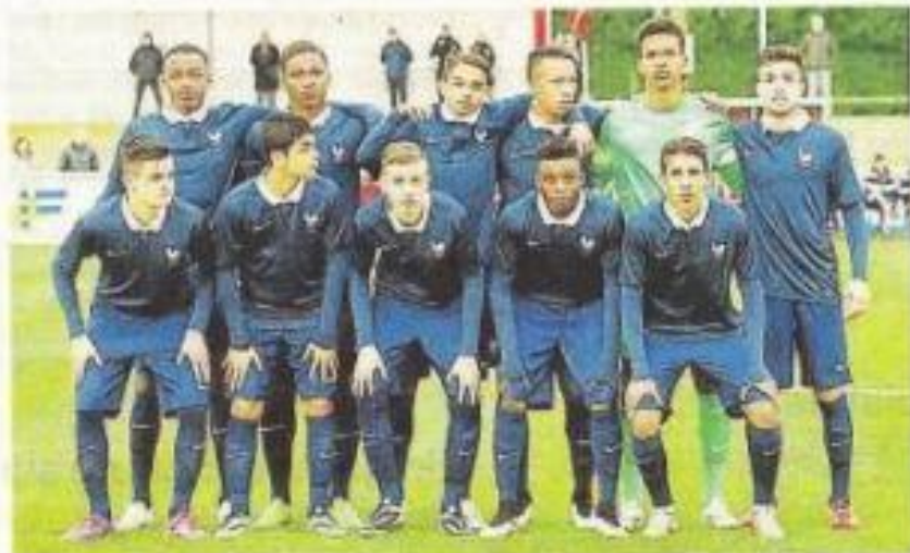
L'équipe de France des moins de 16 ans au Mondial de Montaigu. À droite, un joueur du Stade Rennais en pleine action.

À Montaigu, les joueurs qui jouent pour leur club ont démarré le tournoi