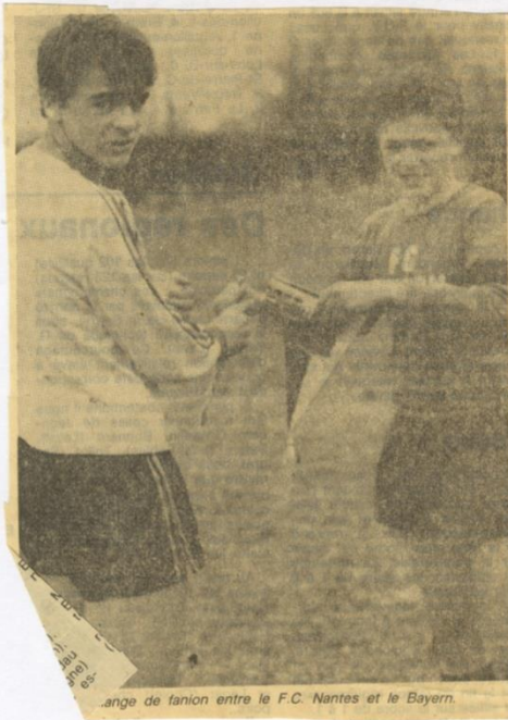
L'ambiance de fanion entre le F.C. Nantes et le Bayern.