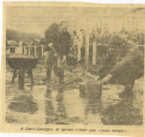
A Saint-Georges, le terrain n'était pas « tous temps ».