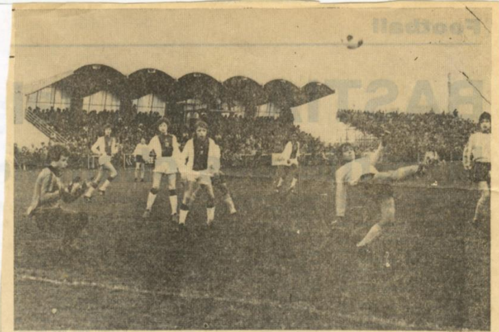
F.C. NANTES - AJAX. — La défense nantaise connaît aussi des moments difficiles.