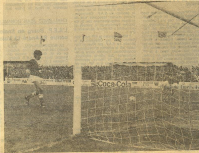
Schmit, en inscrivant ici le deuxième but, rassure les Anglais.

MONTAIGU. — Sélection anglaise bat Israël 2 à 0. Mi-temps, 2-0. Buts : Wall (14'), Smith (25'). Motes romplace Osdone (55'), dans la sélection anglaise. Bon arbitrage de M. Coover.