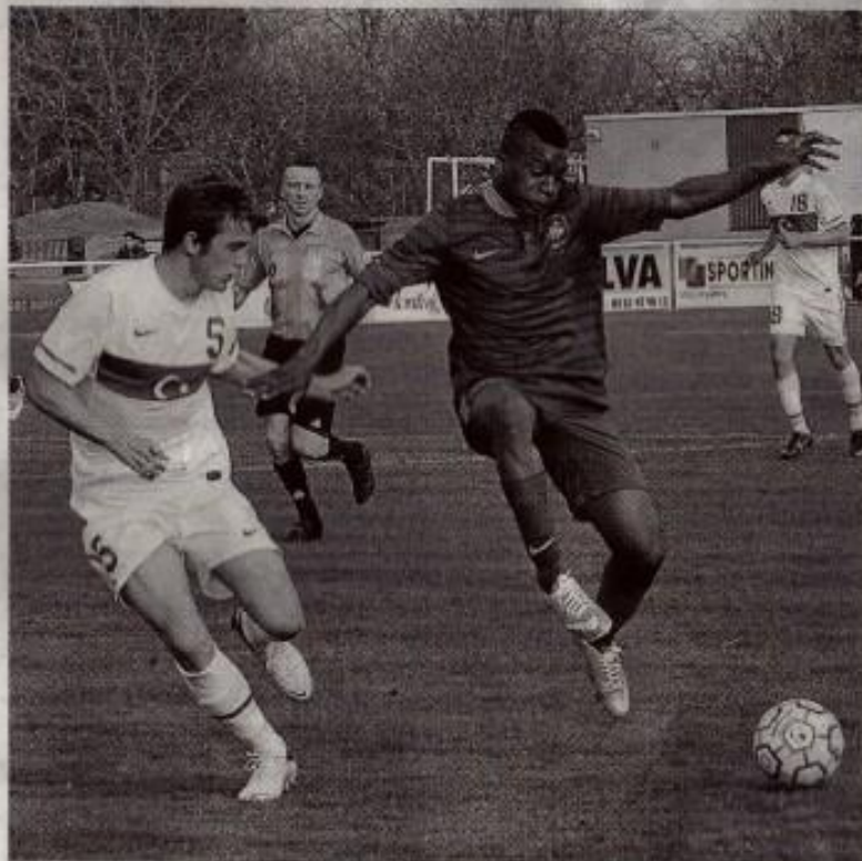
L'équipe de France a déjà joué contre la Turquie en ouverture, le 26 mars. Les quatre derniers matches du challenge nations seront tous joués lundi.

Challenge nations. Lundi 1 er avril. Demi-finales, à 10 h 30, à Saint-Georges-de-Montaigu, et à La Roche