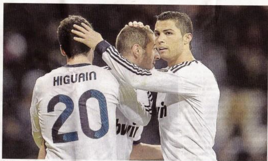
Cristiano Ronaldo et Karim Benzema sont passés par Montaigu. Ils jouent désormais ensemble au Real Madrid.

En 2001, à Montaigu, les journalistes de l'époque avaient repéré ses « dribbles chaloupés » et son style très démonstratif. « Meilleur joueur du tournoi (malgré une blessure au challenge des nations) », il est alors parvenu à devenir le premier joueur français à être élu meilleur joueur du monde.