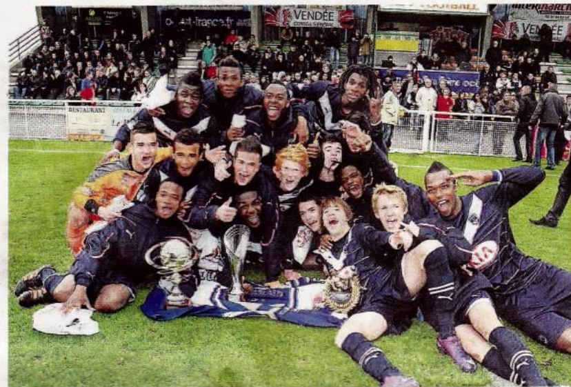
Vainqueurs l'an dernier, les Girondins de Bordeaux reviennent pour le challenge clubs.

Ils sont douze cette année à participer à la compétition des clubs.