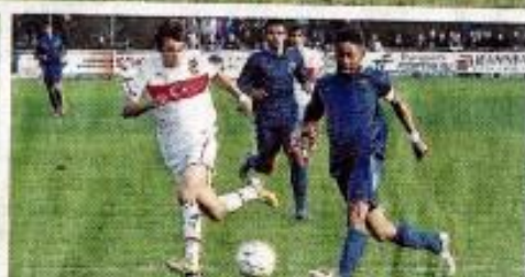
Hier, à Montaigu, les jeunes Français ont bien failli passer à la trappe, face à des Turcs qui n'ont été rejoints qu'à l'extrême.