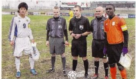
La rencontre entre le Foot solidaire Afrique et l'académie JFA Japon a eu lieu sur le terrain principal, après France-Portugal.