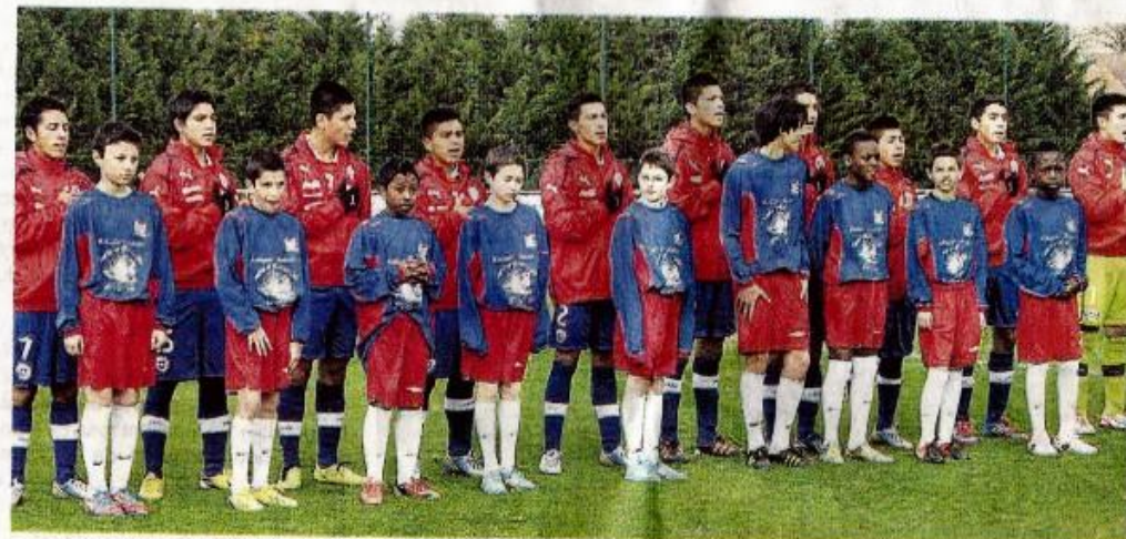
Les Chiliens pendant les hymnes nationaux, avant d'en découdre avec l'Allemagne, mardi soir, à Saint-André-d'Ornay.