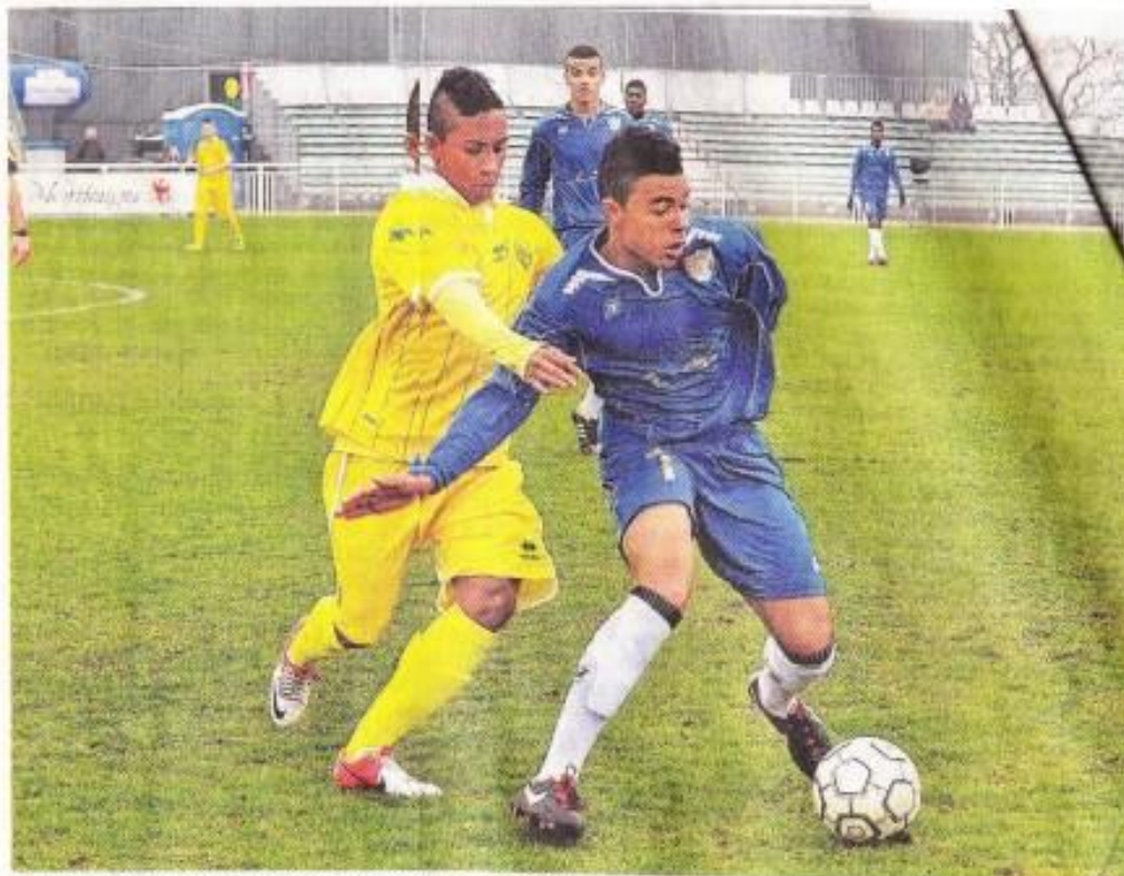
Les jeunes Nantais (le FCN aligne cette année son équipe des U16) a parfaitement bien commencé son tournoi en s'imposant 3-0 sur le Makkah Sports, l'Académie d'Arabie Saoudite. Les Canaris seront opposés à Lorient et Saint-Etienne ce samedi.

Poule 3 : Toulouse - Foot Solidaire Afrique : 2-0 ; Le Mans - JFA Japon : 1-0. Classement : 1. Toulouse et Le Mans 3 pts. 3. JFA Japon et Foot Solidaire Afrique, 0 pt.