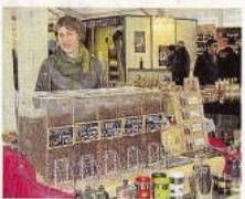
P'tit Kawa, artisan torréfacteur de Concourès-sur-Lognon, propose des cafés 100 % arabica issus du commerce équitable.

Inaugurée hier, cette seconde édition de la foire accueille environ 75 exposants, rassemblés sous un chapiteau de 2 000 m 2 ou présents à l'extérieur. On y trouve tout ce qui fait la diversité d'une foire et pas mal de spécialités gastronomiques locales. Fin des festivités lundi soir. Mais le grand chapiteau, lui, va rester en