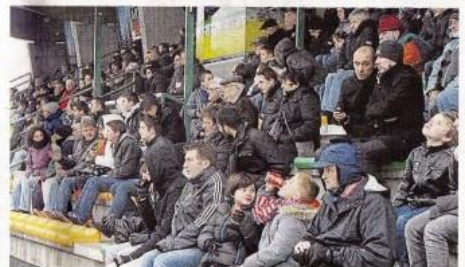
Environ 800 spectateurs ont suivi la victoire de l'équipe de France, au stade Maxime-Bossis.