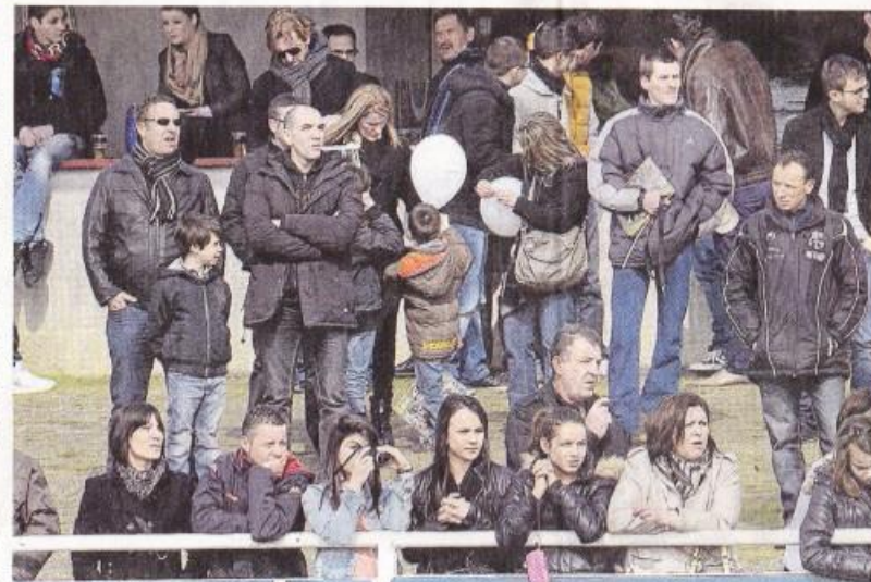
Des femmes, des hommes, des enfants, autour du stade Maxime-Bossis, hier, à Montaigu. Le public du Mondial est d'abord un public familial.

Le Mondial de foot n'est pas un grand raout médiatique. Une grosse dizaine de journalistes y travaille chaque année. On retrouve « la presse généraliste régionale et locale » mais aussi la presse spécialisée foot, papier ( Orze, Mondial ) et Internet (atlantiquefootballclub). Il y a trois ans, le magazine So Foot , à la fois drôle et pointu, avait raconté sa vision décalée du tournoi. À noter : le site de CNN, le grand network américain, a sorti un sujet sur le « Mondial Montaigu youth tournament », consacré à l'académie Foot solidaire Afrique,